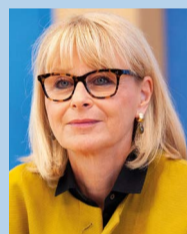
Karin Maag MDB Gesundheitspolitische Sprecherin der CDU/CSU-Bundestagsfraktion

Bewährte Wirkstoffe: Eine Grundlage für Arzneimittelversorgung und neue Therapieoptionen.